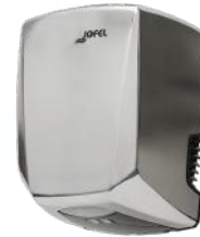
AA57000 8427950367502 Acabado INOX brillo