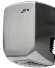
AA57500 8427950367540 Acabado INOX satinado